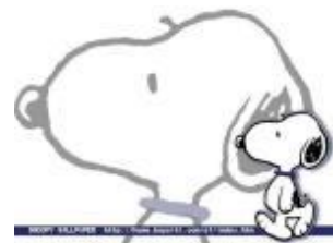
Stg. Kinderopvang Snoopy